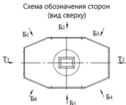
ТЗ на установку закладных элементов

На схемах указать места установки муфт в выбранные стенки колодца, их диаметр и количество в ряду верхнего и/или нижнего элементов колодца, руководствуясь документом «Вариант установки закладных в ККС-5» .